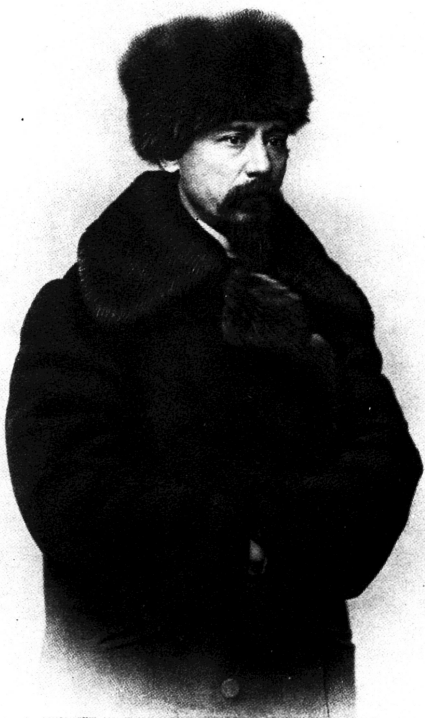
Н. А. НЕКРАСОВ